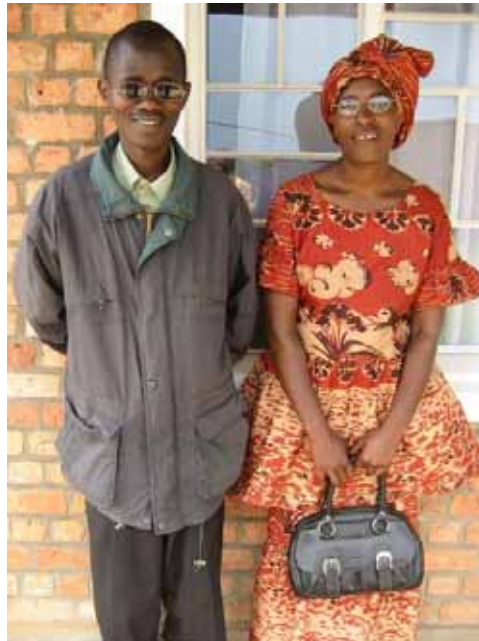
Patienten mit neuen Brillen

In diesen Wochen war zwar das Arbeiten immer spannend und aufregend, aber sicher auch nicht immer leicht. Vor allem die Patienten, denen selbst die Ärzte nicht mehr weiterhelfen konnten, gingen einem manchmal schon an die Nieren. Doch auch für mich gab es in dieser Zeit die kleinen Erfolgserlebnisse, die mir aber immer in Erinnerung bleiben werden. Wer kann sich nicht das Strahlen in den Augen einer Frau vorstellen, die eine Brille mit – 8dpt bekommt.