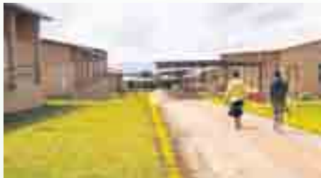
Impulsprojekt in der Region: das Krankenhaus in Ruli.

ter Bruch steht (Anmeldungen dazu bis 15. August per Email an info@golfamdonnersberg.de ). Die Einnahmen des Turniers gehen zugunsten des Vereins Krankenhaus Ruanda.