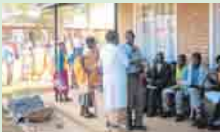
„Motor für die ländliche Entwicklung“

„Die Idee war von Anfang an, Kompetenzen vor Ort zu bilden und den Betrieb in eigene Hände zu übergeben.“ Mit dieser Philosophie habe man spezielle Kompetenzen in Ruli verankert, verweist Schmitt exemplarisch auf den Aufbau einer Augenklinik. „Die Augenabteilung steht nun auf eigenen Füßen.“ Ebenfalls nennt er beispielhaft die Einrichtung eines Aidshauses, das sich insbesondere der Behandlung von schwangeren Patienten sowie der Aufklärung und Präventivarbeit verschrieben hat.