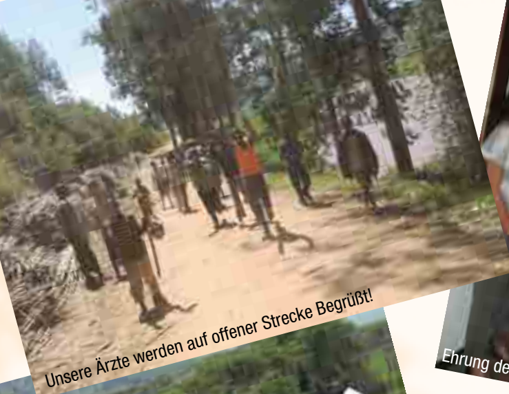
Unsere Ärzte werden auf offener Strecke Begrüßt!