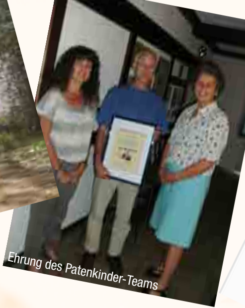
Ehrung des Patenkinder-Teams