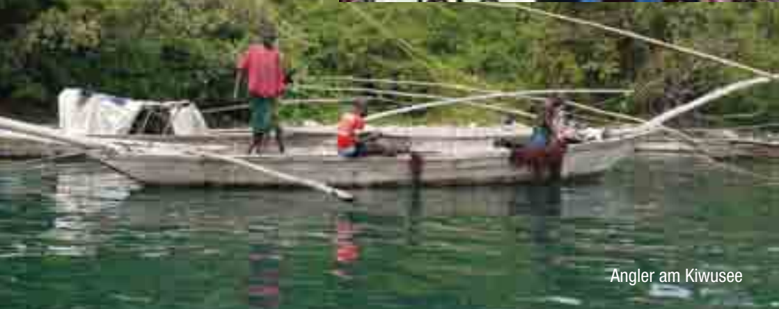
Angler am Kiwusee