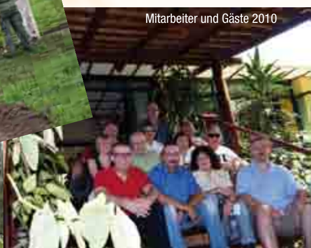
Mitarbeiter und Gäste 2010